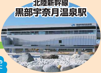
北陸新幹線 黒部宇奈月温泉駅

●ご予約・お問い合わせ先 おもてなし魚津直行便専用コールセンター 金間タクシー 魚津交通 ご予約はこちらまで 0120-489-054 よくて おこしくささい